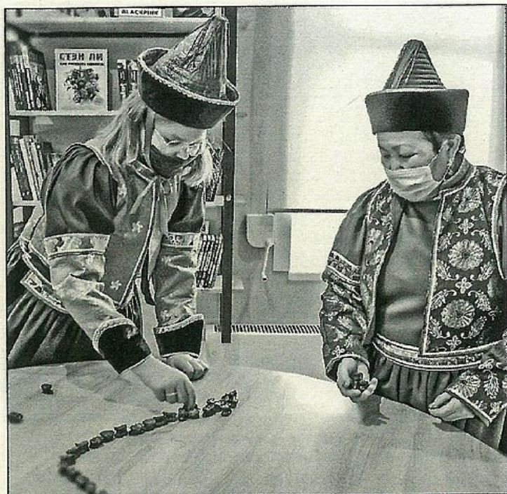
■ Ребята знакомят с бурятской забавой «Шагай наадан», которая появилась задолго до привычных нам настольных игр

ся самым простым. Собрали мощный коллектив. У всех, кто к нему примкнул, горели глаза и была полная готовность действовать. Оставалось только назначить даты.