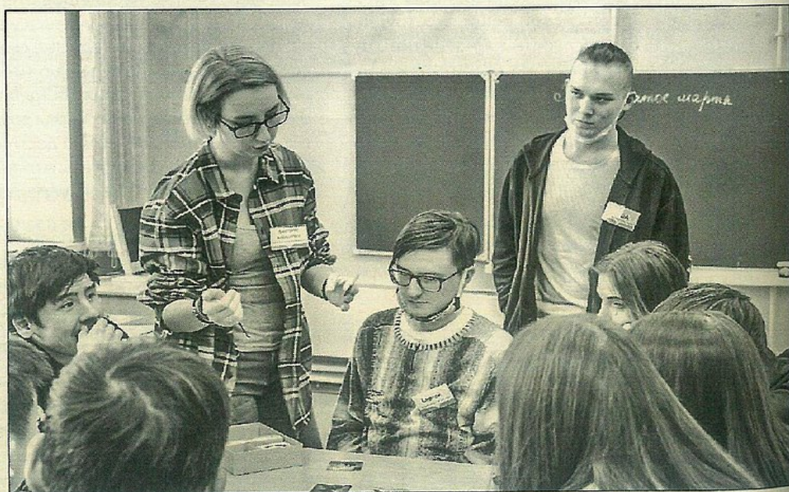
■ Командам нужно, расшифровывая закодированные сообщения на карточках с рисунками, оказаться в нужной локации. При этом следует быть внимательными, чтобы избежать встречи с противником

Многие удивляются, но для подготовки таких событий, как фестиваль настольных игр, нам обычно хватает одного собрания, всё остальное делается дистанционно. Достаточно в общих чертах обсудить план работы и дать людям спокойно трудиться самостоятельно. Поэтому месяц, отводившийся на организационные работы, специалисты посвятили выполнению своих задач — рекламе мероприятия, а также оформлению площадок для него.