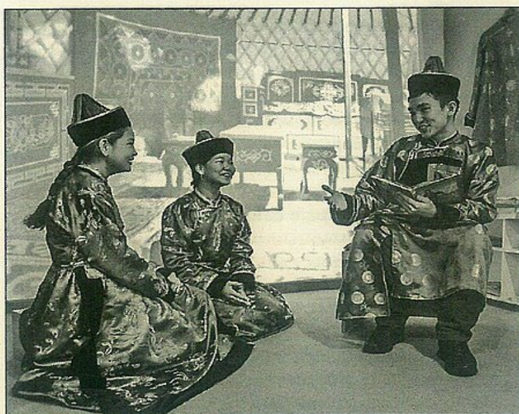
■ В шатре одновременно воссозданы загадочный мир Востока с его волшебными сказками и атмосфера бурятской юрты

Благодаря тому, что библиотека прошла верификацию, сотрудники могут проставлять верифицированные часы. Именно они (а не обычные электронные) дают дополнительные баллы при поступлении в вузы. Поэтому у ребят есть ещё один стимул, чтобы нам помогать.