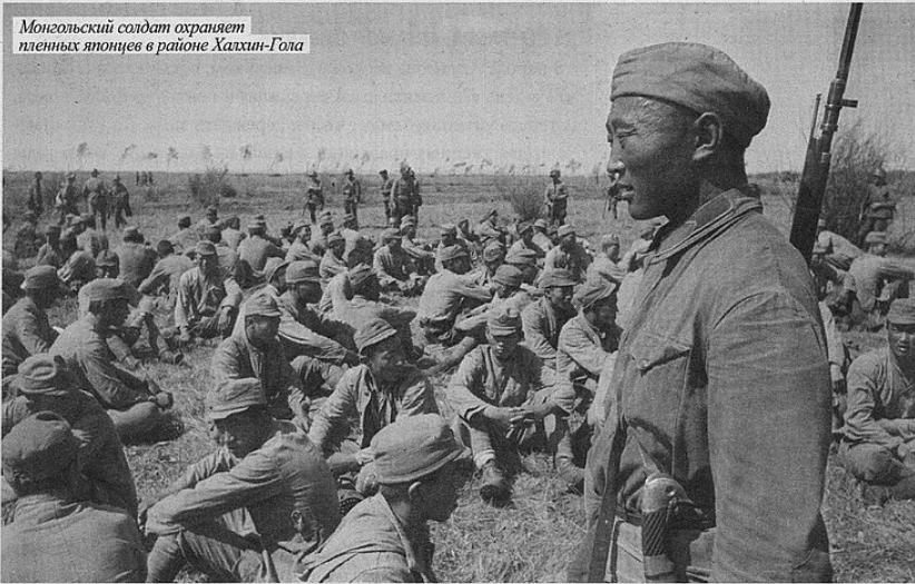
Монгольский солдат охраняет плененных японцев в районе Халхин-Гола