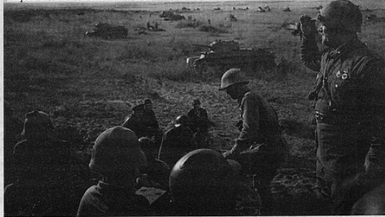
Советские офицеры перед атакой на Халхин-Голе

У Красной Армии уже были огнемётные танки, а японцы применяли бактериологическое оружие. До сих пор с периодичностью в два-три года в тех местах происходят вспышки сибирской язвы