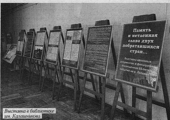
Выставка в библиотеке им. Калашникова