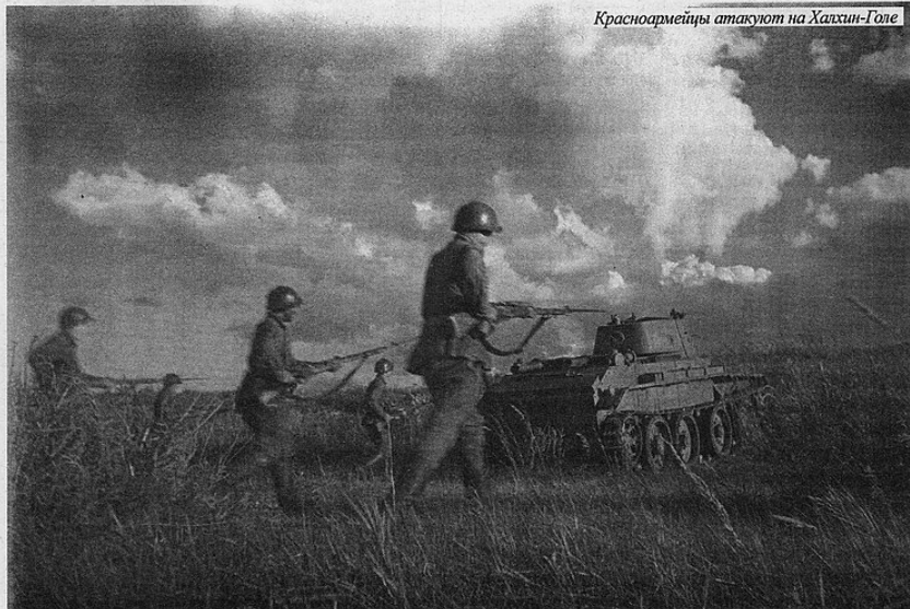
Красноармейцы атакуют на Халхин-Голе

го, тем более что до назначения командующим советской группировкой Георгия Жукова штаб располагался далеко от места боёв и управление войсками было слабое. Госпитали находились в Чойбалсане, самых безнадежных увозили в Читу.