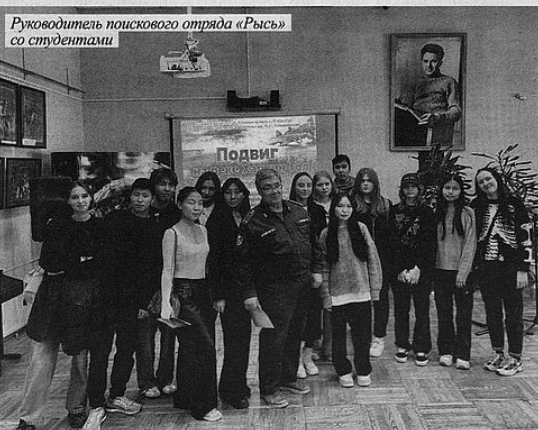
Руководитель поискового отряда «Рысь» со студентами