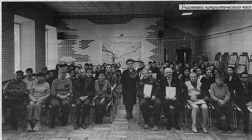
Участники патриотического часа

– С 1926 года китайцы и японцы зарились на Монголию, совершали нападения и провокации. В 1938 году японцы на трех грузовиках и двух танках сделали попытку захватить приграничные территории, но их разбомбила наша авиация. Приграничные конфликты японцам были выгодны – повоевали и ушли, границу с Китаем наши