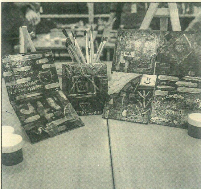
■ Судя по работам, созданным на мастер-классе, среди участников есть талантливые концептуалисты