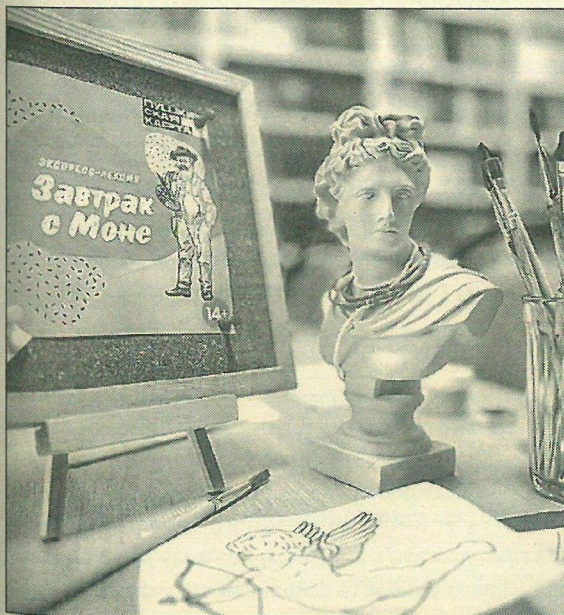
■ Сходить на лекцию по искусству — отличный способ использовать «Пушкинскую карту»!

Третья лекция прошла в формате аналитической беседы. Заглавие мы сформулировали в виде